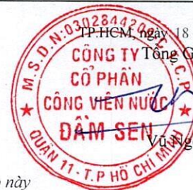
Vũ Ngọc Tuấn

Bản thuyết minh báo cáo tài chính hợp nhất là phần không thể tách rời của báo cáo này